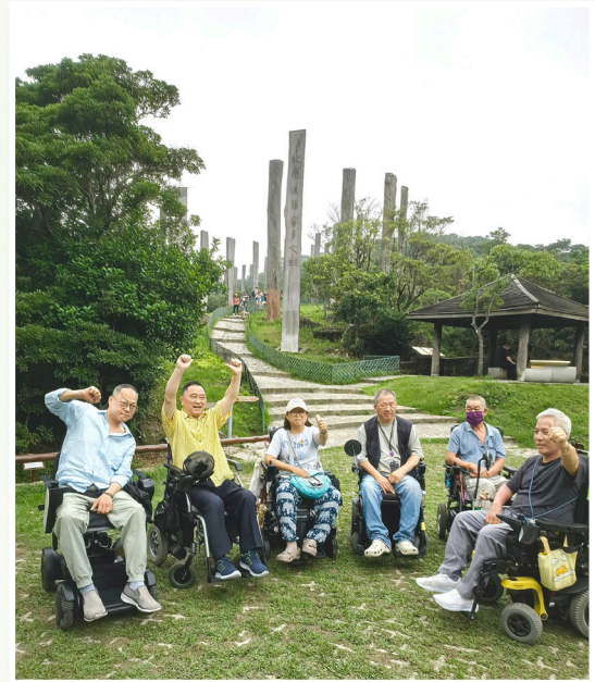
《水鄉微風·與輪同行》 大澳郊遊日