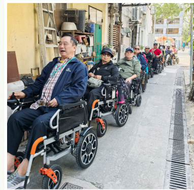
《風采飛輪·濕地逍遙遊》